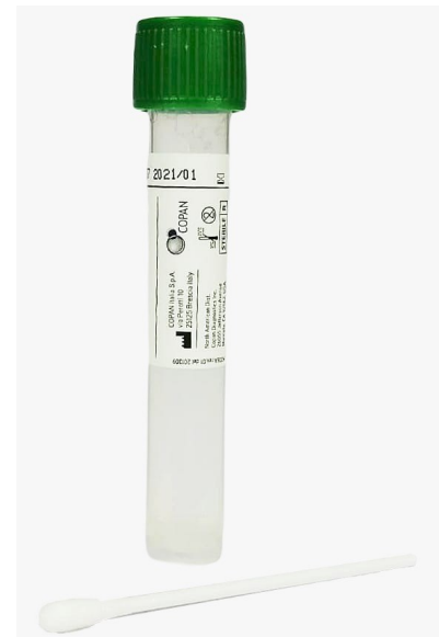
Unidad de Swabs Sago® con solución SRK

Swabs estériles con punta de poliéster, para muestreo de superficies conformados por un hisopo de rayón en una varilla de 10 cm de largo, este hisopo viene integrado a la tapa del tubo, el tubo contiene 10 ml de solución neutralizante, que inhibe residuos de sanitizantes y detergentes utilizados en los procesos de limpieza.