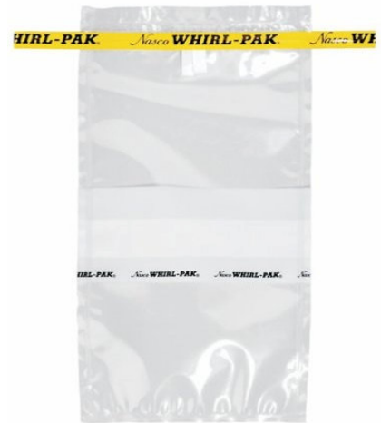
Bolsa de muestreo Whirl-Pak 18 onzas.