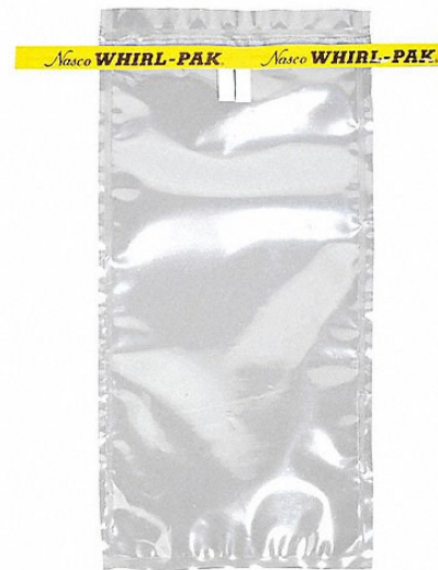
Bolsa de muestreo Whirl-Pak 18 onzas