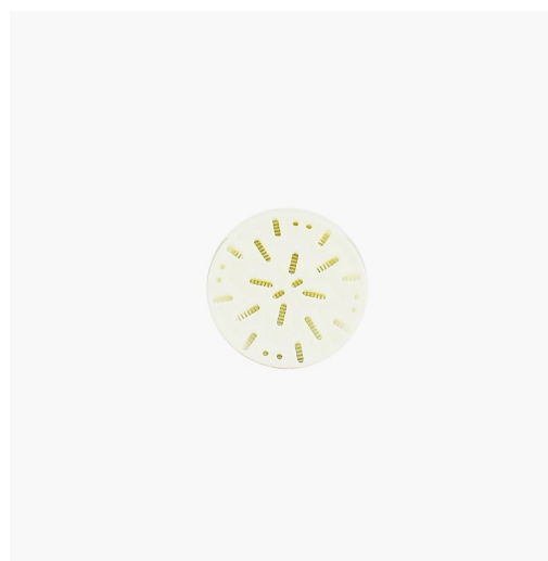
Soporte de polipropileno para membrana de 47 mm