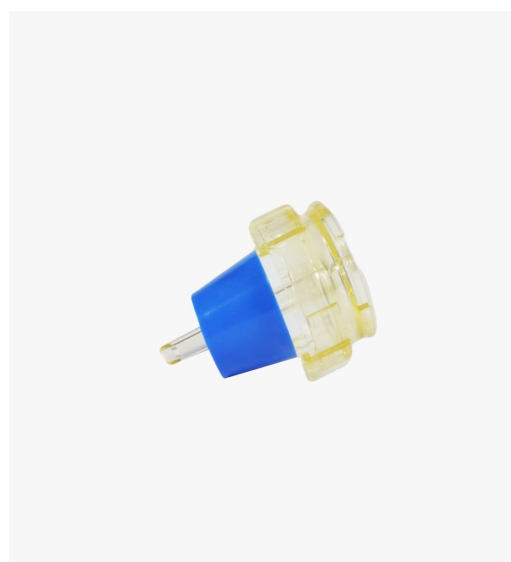
Base para unidad de filtración de polisulfona